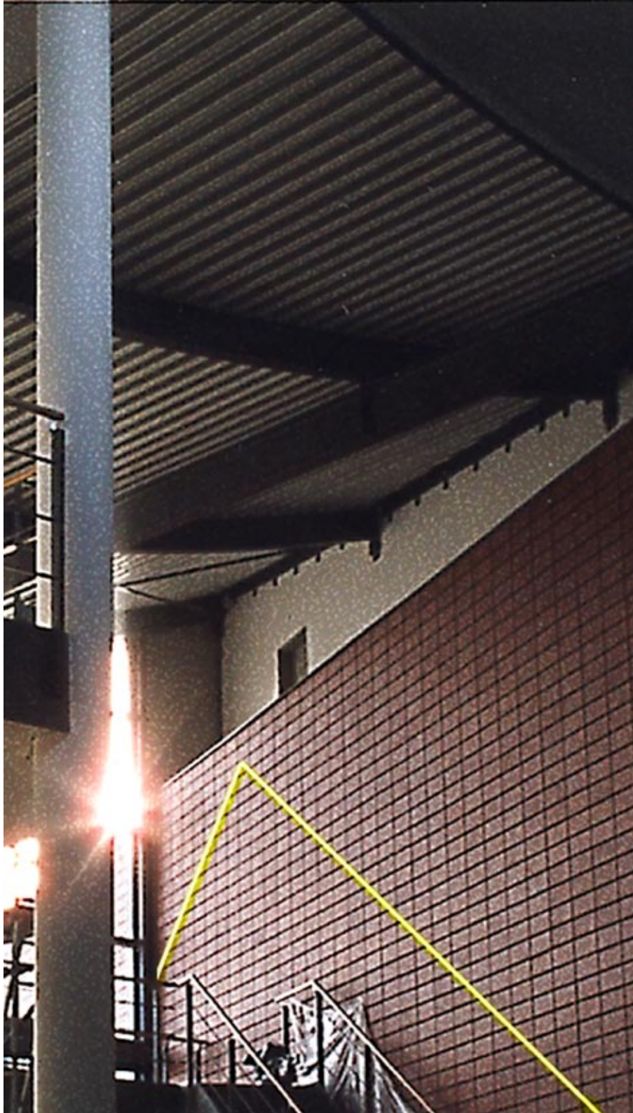
Studentischer Wettbewerb „Kunst am Bau“ Max-Planck-Institut für Plasmaphysik Greifswald