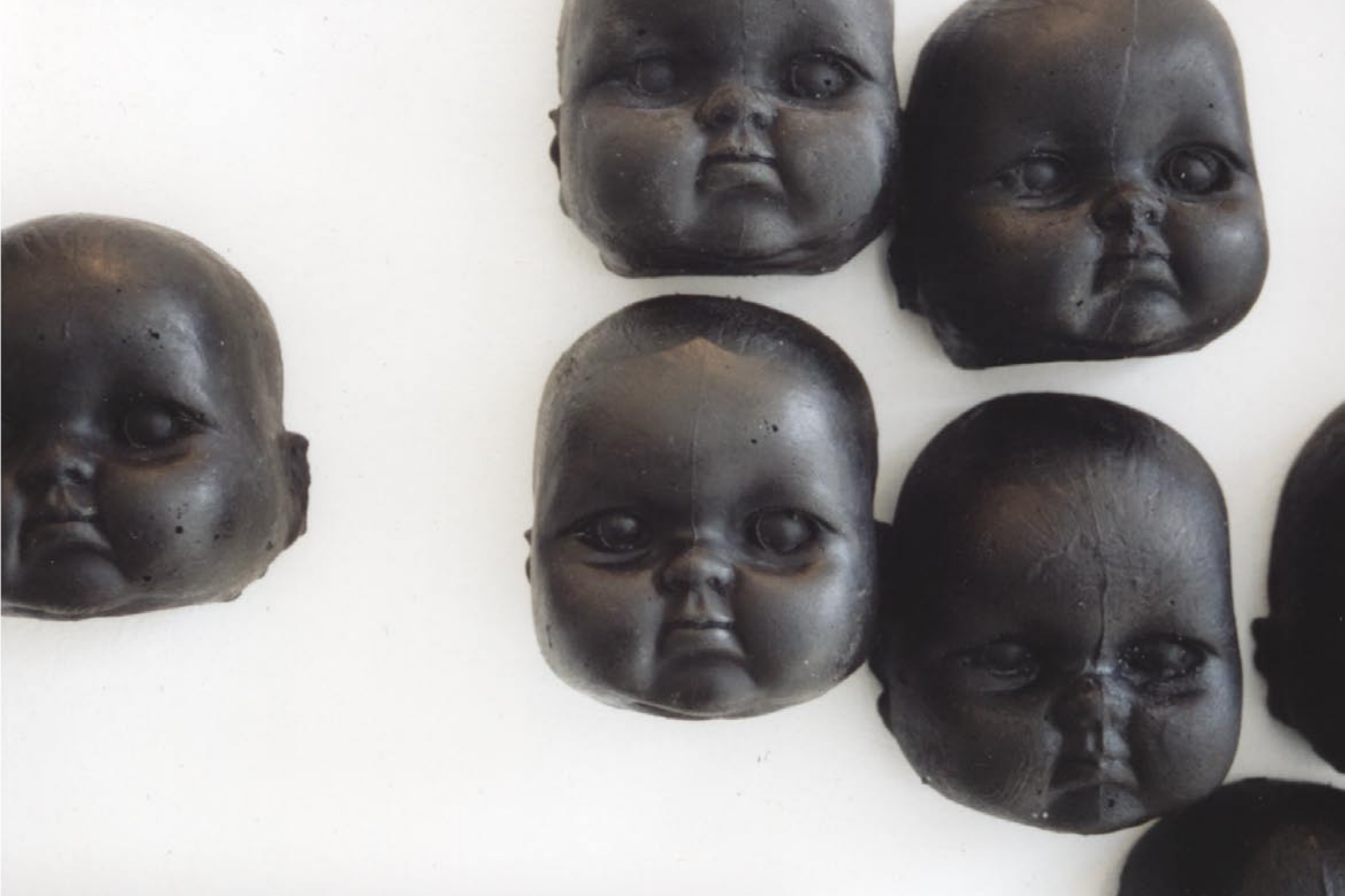
„zu musterknaben“, Caspar-David-Friedrich-Preis 2003