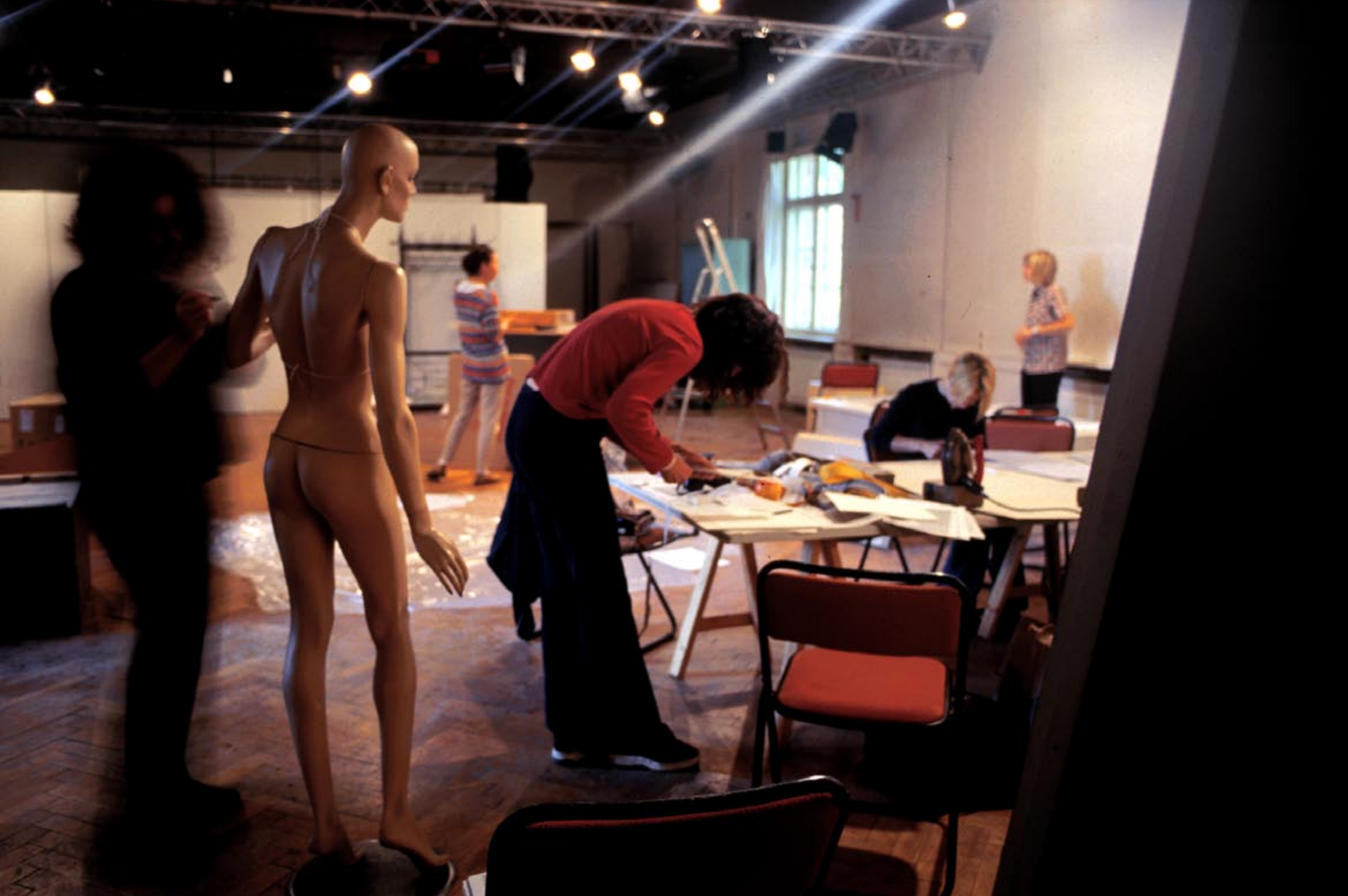
Arbeit in der Medienwerkstatt