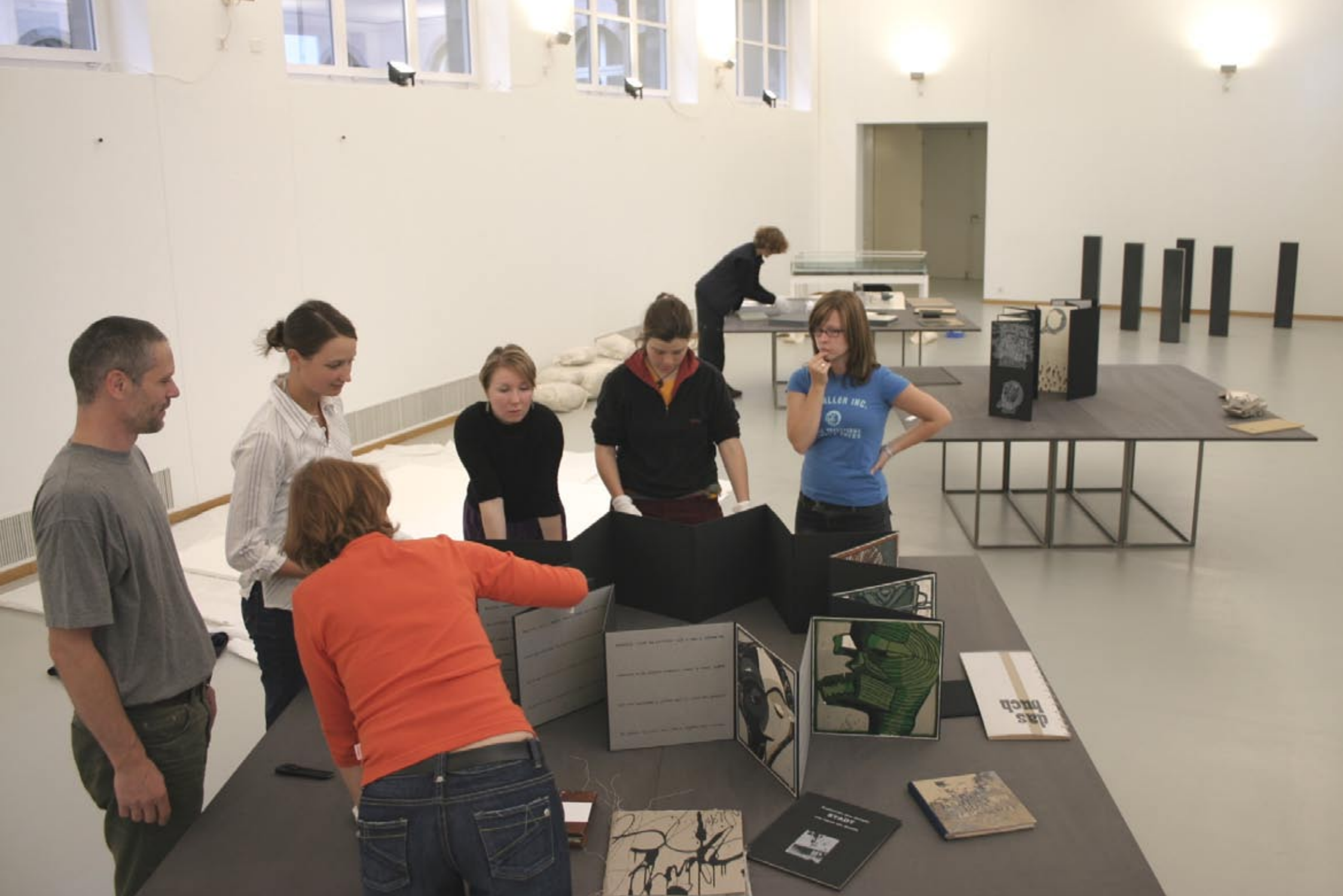
„Büchersendung“, Ausstellungsaufbau Basel 2004